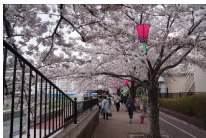
„Alltag“ im April-Kirschblüte

normalen Alltag auch deshalb, weil er in den letzten Monaten eher eine Sehenswürdigkeit war. Wir sind froh, wenn ein Tag normal abläuft und sich eine gesunde Regelmäßigkeit einstellt. Eine normale Woche setzt sich für uns als Familie ganz unterschiedlich zusammen.