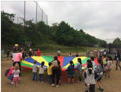
Gruppenspiel beim Festival

sehr ermutigend, dass viele neue Leute gekommen sind.