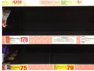
Gähnende Leere im Chips-Regal

In den letzten Wochen war Japan von einer schweren Kartoffelchips-Krise betroffen. Durch die Taifune im letzten Jahr fiel die Kartoffelernte schlecht aus und so kam es zu Lieferengpässen im ganzen Land. Mittlerweile kann Japan aber wieder aufatmen und auch wir haben die Krise unbeschadet überstanden. ☺