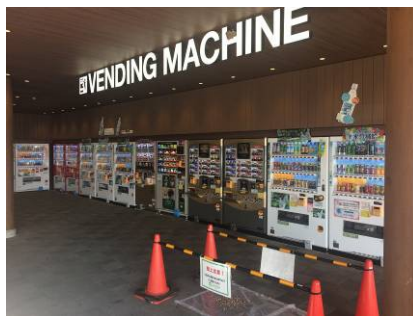
Vogel-Alltag. Die Absperrung schützt vor ungewollten „Treffen“. ☺

Seit diesem Monat gehören auch jede Menge Zahlen zu meinem Alltag. Als Kassierer bin ich für die Finanzen des Missionarsteams und der religiösen Körperschaft zuständig. Ich bin noch dabei, mich in diese Aufgabe einzuarbeiten und sehe es als Herausforderung an, meine bisherigen Grenzen zu erweitern.