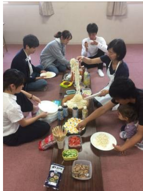
Abendessen mit Jugendlichen

richtigen Fragen zu stellen, die ihn auch wirklich weiterbringen. Aber es macht sehr viel Freude, den Mitarbeiter bei einer Entwicklung zu fördern und zu sehen, wie der Hl. Geist uns immer wieder auf die Treffen vorbereitet.