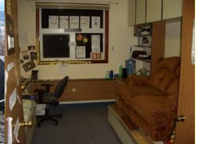
Ich bei der Arbeit